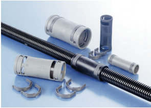
Connection Splice or flexible Conduits, IP68